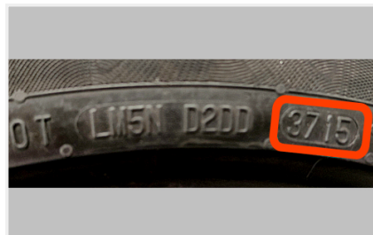
DOT с датой производства