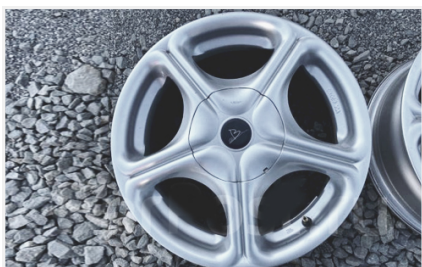
Лицевая сторона (фото для каждого диска)

Сфотографируйте диски, как показано на примере. Напишите марку/модель автомобиля, на котором эксплуатировались + диаметр диска (текстом, фотографии автомобиля не нужно).