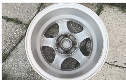
Внутренняя часть диска, информация на лучах