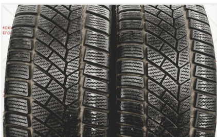
Общее кол-во шин