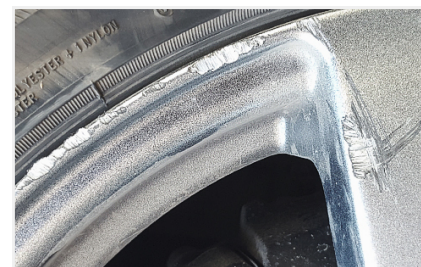
Повреждения (если таковые имеются)